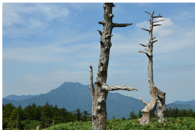
▲ 瓶ヶ森名物 白骨林